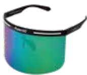
BLACK/GREEN ¥6,000 (税込 ¥6,600)