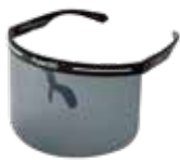
BLACK/GRAY ¥6,000 (税込 ¥6,600)