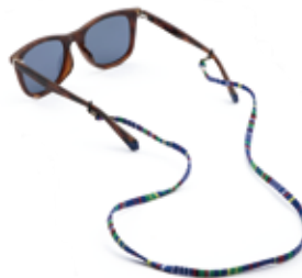
IPR(C3) ¥10,000 (税込 ¥11,000)