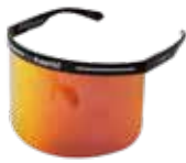
BLACK/RED ¥6,000 (税込 ¥6,600)